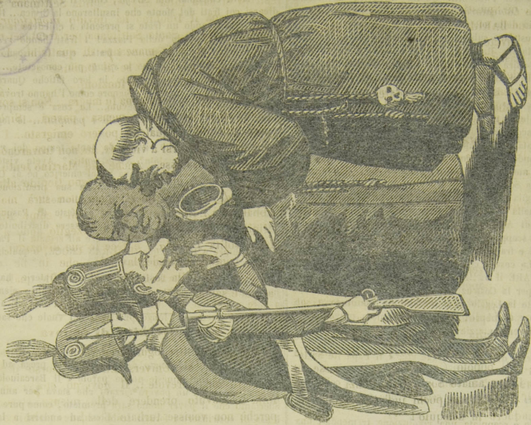
IMPOSTORI!! (col Potere)