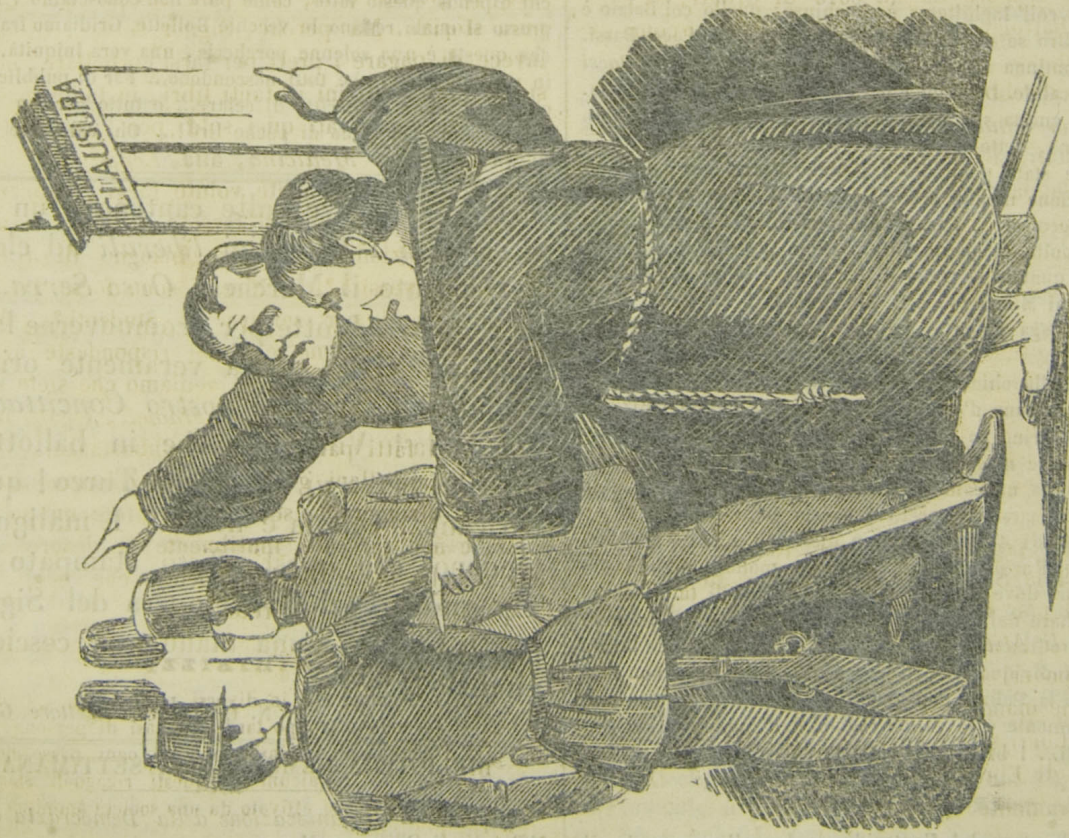
BRICCONI!! (col Popolo)