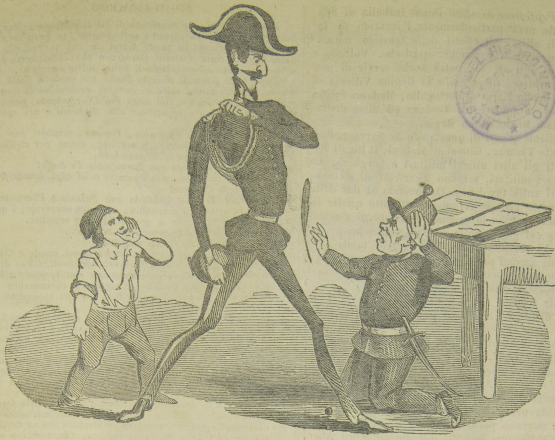
Zebedeo I. che bombarda i sottoscrittori per la legge Siccardi.