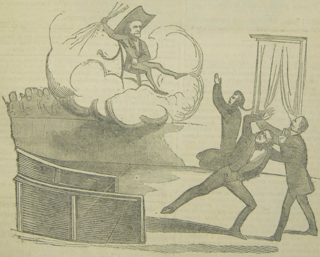
Bigio Tom-Pouce figlio del Corsaro che fulmina i nuovi giganti.