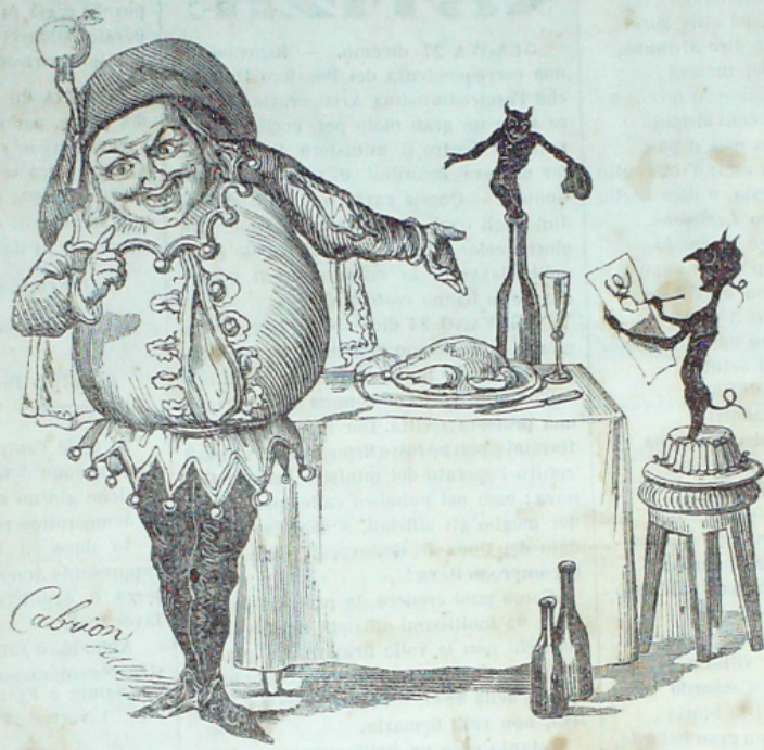
Scherzo e bevo, derido gl'insani Che si dan del futuro pensier.