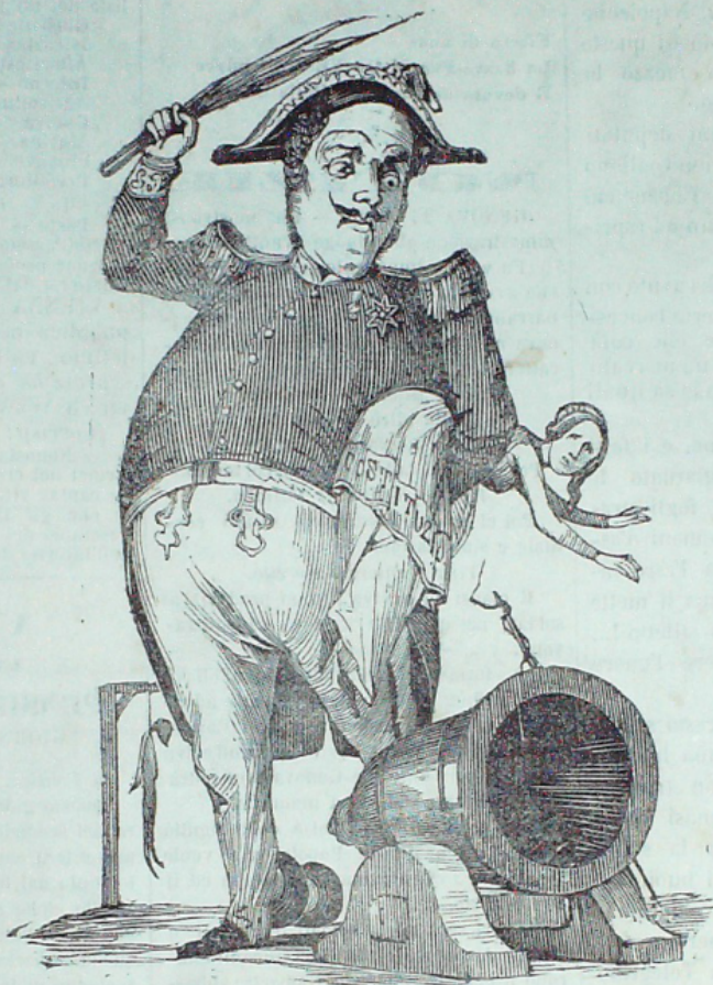
RE BOMBA — Così sento di esser pio —

più cosa fare. Per carità non vi scoraggiate! Con lo sbagliar s'impara, dice il proverbio, dunque andate sicuri che anche voi avete tutti i certificati d'aver imparato a rimettere a nuovo il vostro stivale. E quando tornerete all'opera, invece di perdervi sulla questione della vernice, e della gamba, procuratevi