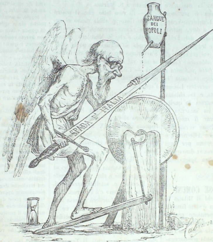
Come me l'hanno sciupata!!!... neppure se fosse stata in mano a un ragazzo...

tori abbiano l'intelletti sani , è facile vedere il motivo perchè Dante sia passato di moda. — Nonostante io lo studio sempre, e trovo che sotto il velame delli versi strani il Poeta fa da profeta (non fa da Gioberti, intendiamoci bene!) e parla nè più